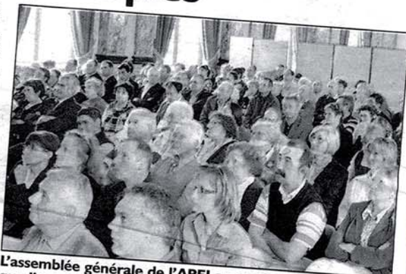
L'assemblée générale de l'APEI a permis de rappeler que l'utilisateur est au cœur de son action

L'assemblée générale a ensuite laissé place à une table ronde sur l'évaluation des pratiques par rapport aux usagers. En effet depuis 2007 et la dernière réforme statutaire des associations, un nouveau collège a été mis en place, celui des usagers. Désormais deux usagers sont membres du conseil d'administration de l'APEI de l'Aube. Des évaluations en interne ont permis à l'association de connaître des avis positifs ou négatifs des usagers sur leur cadre de vie et sur le fonctionnement de l'association. En réponse à ces points de vue, les équipes ont appris à s'adapter