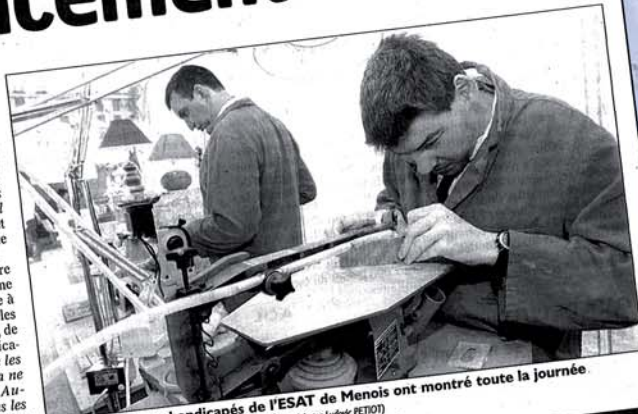
Deux travailleurs handicapés de l'ESAT de Menois ont montré toute la journée au public leurs talents de menuisier