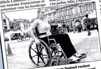
Pas facile de prendre place sur un fauteuil roulant et de suivre un parcours. On voit la vie différemment

Les personnes en situation de handicap ne seraient donc pas traitées comme des citoyens à part entière, à écouter les bénévoles présents. Poser la question, c'est parfois, hélas, y répondre.